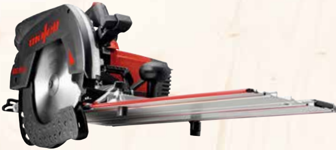
Kappschiene-Säge KSS 80 cc /370