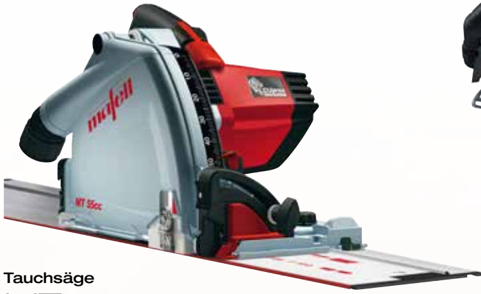
Tauchsäge MT 55 cc MidiMAX im T-MAX mit F 160