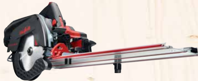
Kappschiene-Säge KSS 60 18M bl